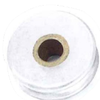
mm 25 - 32