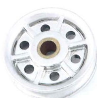
mm 50 - 75