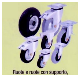
Ruote e ruote con supporto, con anello in gomma morbida