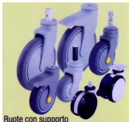
Ruote con supporto in materiale sintetico e per Design