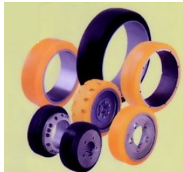
Ruote ed anelli per carrelli elevatori