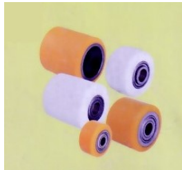
Ruote e rulli per transpallets