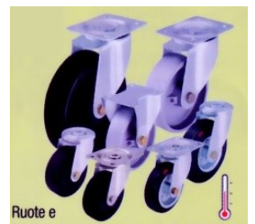
Ruote e ruote con supporto, per alte temperature