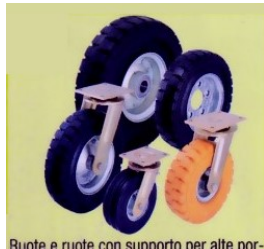
Ruote e ruote con supporto per alte portate, con anello in gomma superelastica