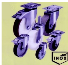
Ruote con supporto in acciaio inox