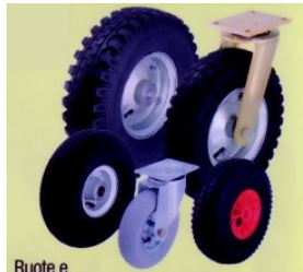
Ruote e ruote con supporto, con pneumatico