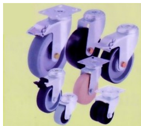
Ruote e ruote con supporto istituzionale