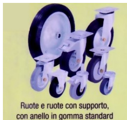
Ruote e ruote con supporto, con anello in gomma standard ed anello in gomma termoplastica