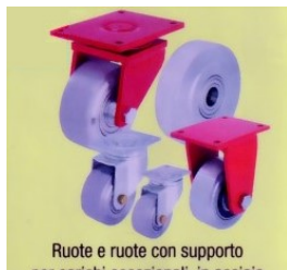
Ruote e ruote con supporto per carichi eccezionali, in acciaio