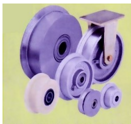
Ruote e ruote con supporto, con bordino