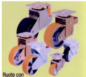
Ruote con supporto ammortizzato per alte portate