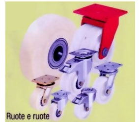
Ruote e ruote con supporto per alte portate, in nylon