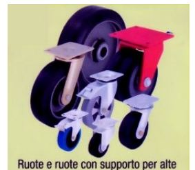
Ruote e ruote con supporto per alte portate, con anello in gomma elastica