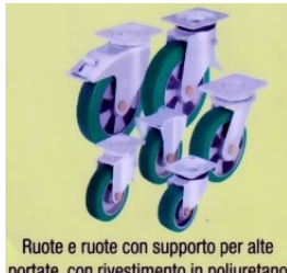
Ruote e ruote con supporto per alte portate, con rivestimento in poliuretano colato Blickle Softthane®