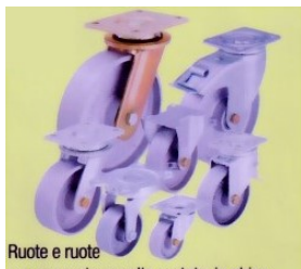
Ruote e ruote con supporto per alte portate, in ghisa