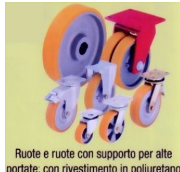
Ruote e ruote con supporto per alte portate, con rivestimento in poliuretano colato Blickle Extrathane®