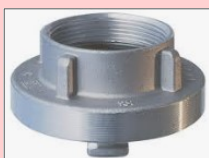
FEMMINA FISSO FEMMINA GIREVOLE