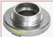
MASCHIO FISSO MASCHIO GIREVOLE