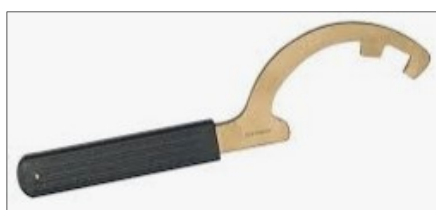
CHIAVE DI SERRAGGIO